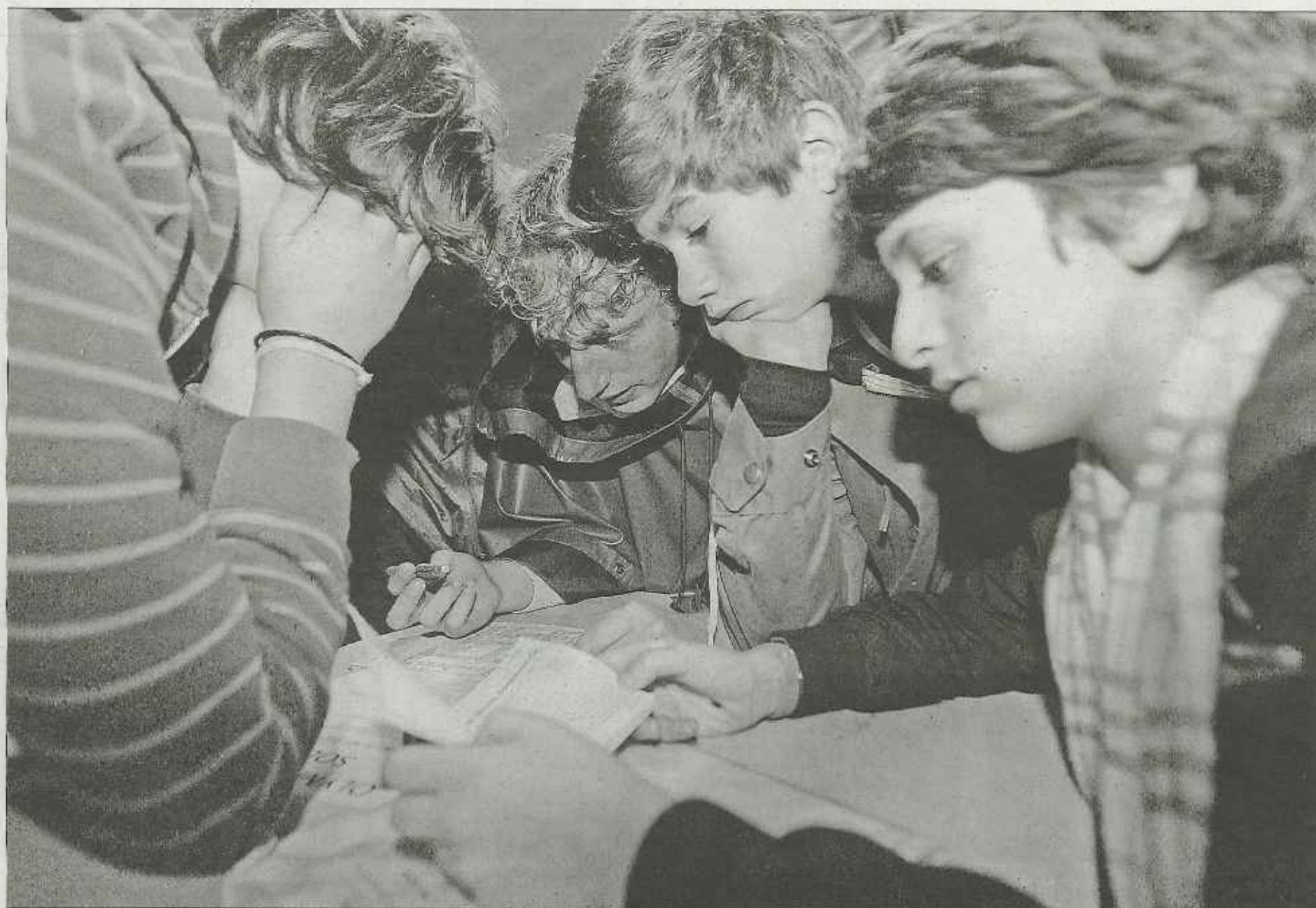
Malgré la fatigue de la nuit, intense concentration autour d'un scrabble initiatique et pédagogique. Il s'agissait de ne pas se tromper afin de recueillir les précieux « Loyolas ». Tentes et salles étaient aussi un lieu d'accueil chaleureux pour se protéger de la fraîcheur et de la pluie, et chaque victoire faisait oublier la morosité du ciel.