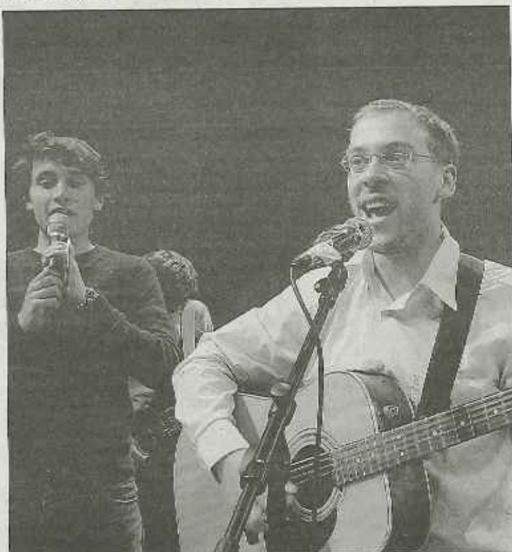
La cérémonie fut on ne peut plus musicale. Lycéens et collégiens ont pu participer à des chants religieux modernes où batterie et guitares avaient toute leur place. Ils ont également, avec difficulté, tenté d'entonner un chant du Burundi. Un exercice plus périlleux mais bon enfant.

Annonces classées extra-locales : Espace Régions, tél. 01 55 38 21 70