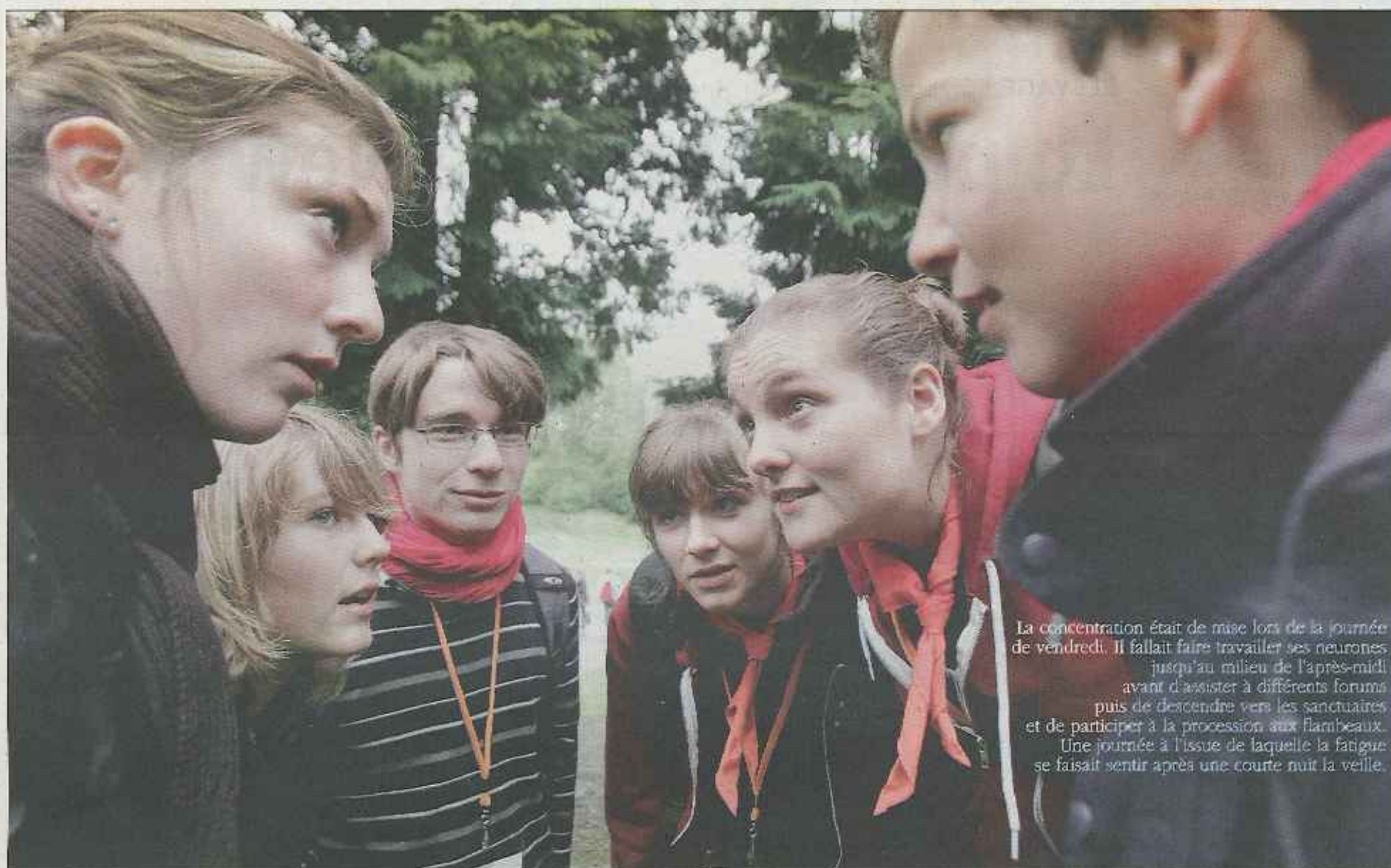
La concentration était de mise lors de la journée de vendredi. Il fallait faire travailler ses neurones jusqu'au milieu de l'après-midi avant d'assister à différents forums puis de descendre vers les sanctuaires et de participer à la procession aux flambeaux. Une journée à l'issue de laquelle la fatigue se faisait sentir après une courte nuit la veille.