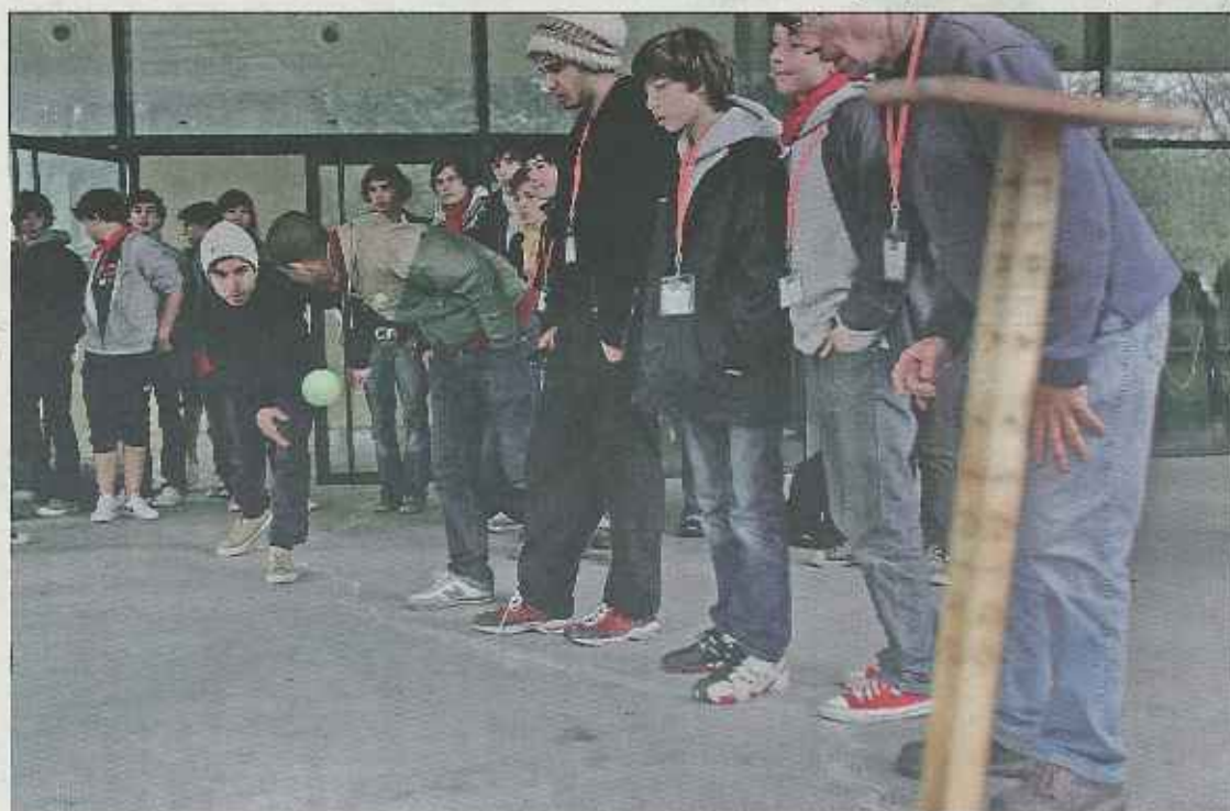
Le seul jeu ayant échappé à la pluie, le tibia d'Inigo. En rapport avec l'histoire du fondateur de l'ordre des jésuites, il fallait symboliquement envoyer un boulet de canon (une balle) sur une pièce de bois (la jambe d'Ignace de Loyola) afin que celui qui était avide de gloire devienne imprégné de foi.