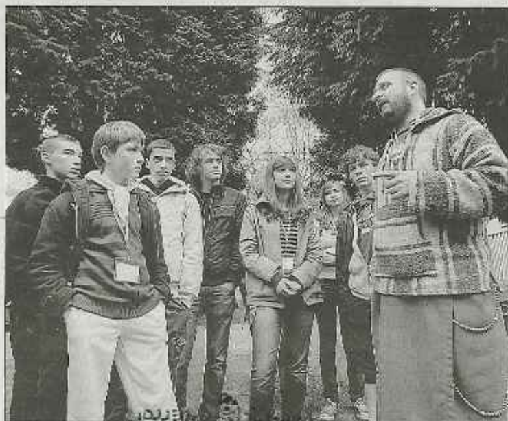
Des quizz ponctuaient le parcours des Olympiades solidaires. Ici c'est le thème des réfugiés dans le monde qui avait été retenu et les questions étaient loin d'être évidentes.

On ne soulignera jamais assez l'efficacité de l'encadrement qui, pour cette première, a dû improviser à maintes reprises, au regard du programme initial afin de maintenir convivialité et fraternité lors de ce rassemblement pèlerinage terriblement humide.