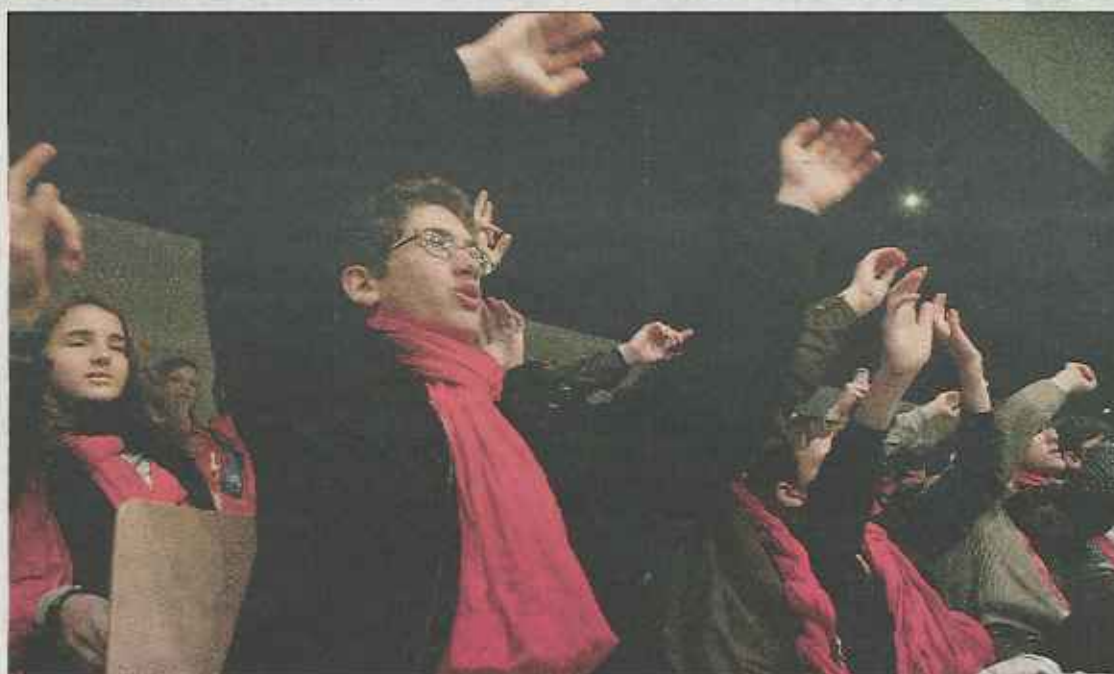
On croyait les Parisiens amorphes dans la salle Padre Pio alors que la journée ne faisait que commencer. Quelques notes de musique ont suffi à réveiller leur engouement.

Au fil des siècles, la Compagnie s'est mise au service de l'annonce de l'Évangile, tentant de trouver les moyens les plus adaptés aux orientations des diverses époques. Pour cela, les jésuites cherchent du côté d'un petit livre rédigé par Ignace de Loyola, « Les Exercices Spirituels », les expériences issues de l'amour de Dieu débouchant sur un profond désir de servir le Christ et l'Humanité. D'où ce désir de se rendre partout dans le monde. Les jésuites sont aujourd'hui 19 000 répartis au quatre coins de la planète.