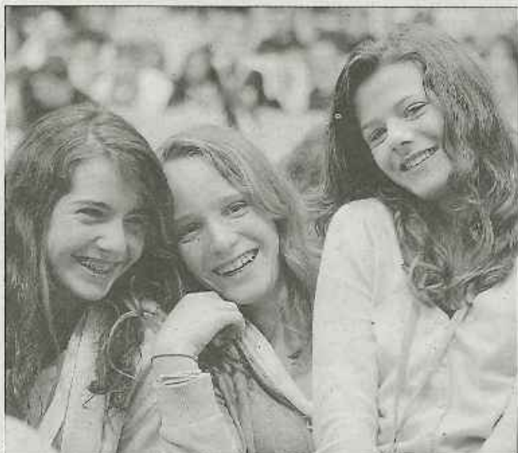
La joie d'être réunis, de faire partie d'une même famille, était aussi l'une des thématiques de ce pèlerinage rassemblant 1500 jeunes et 1000 adultes. Un pari pour le moins réussi à l'image de ces trois jeunes filles.