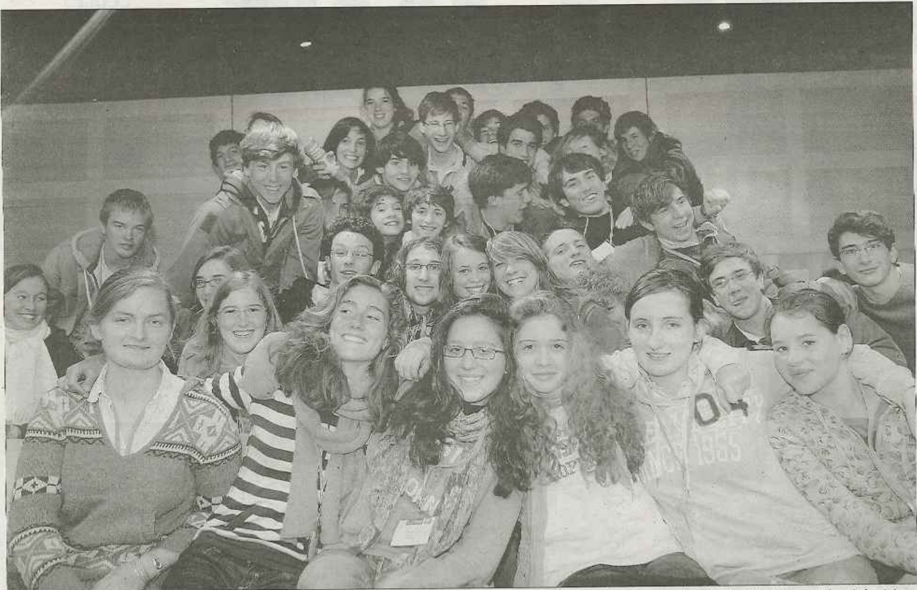
Malgré une nuit sous la tente pour le moins écourtée par les fortes pluies, les élèves de l'établissement Saint-Joseph de Reims avaient tout de même la pêche, hier matin lors de la cérémonie d'ouverture précédant les Olympiades solidaires. L'établissement de Reims est quadricentenaire et développe une pédagogie originale axée sur la responsabilisation.