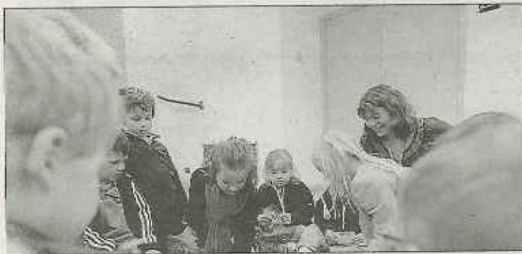
Le rassemblement pèlerinage des établissements jésuites de France accueillait adultes et adolescents des quatre coins de France. Mais qu'en était-il pour les plus petits ? Un service de garderie était mis en place en l'église Sainte Bernadette.