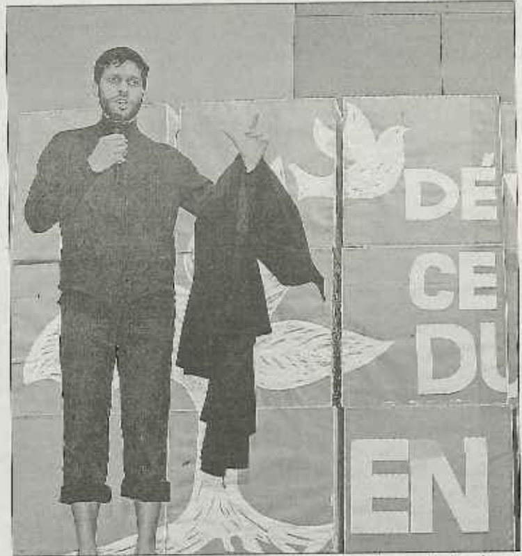
Impossible de ne pas évoquer l'œuvre transmise par Ignace de Loyola, natif du Pays Basque et fondateur de la Compagnie de Jésus. Ceci devant un mur de brique portant l'inscription de la thématique de ces journées : « Développe ce qui est durable en toi ! ».