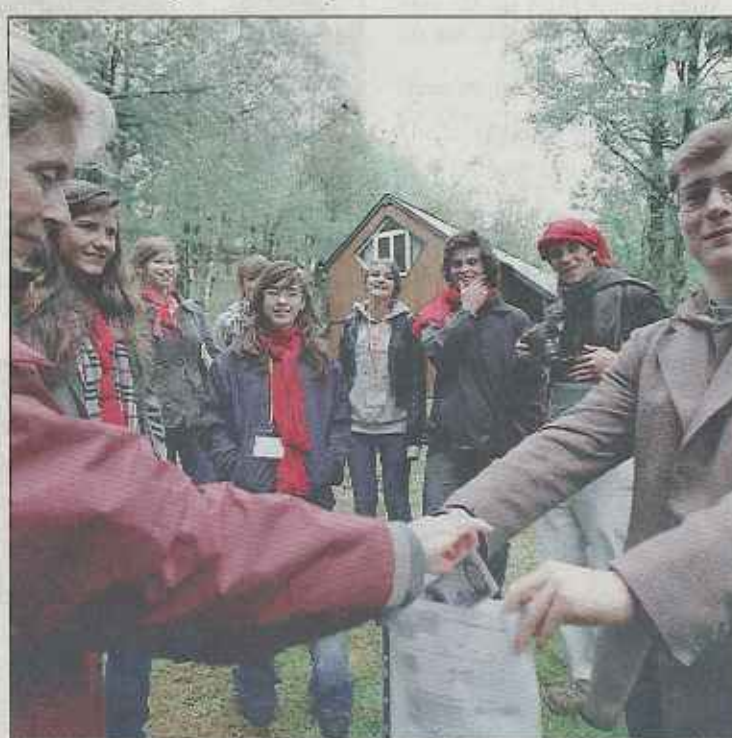
Combien de réfugiés rentrent sur le territoire français chaque année ?.. Les deux équipes ont répondu correctement. Résultat : des « Loyolas », encore des « Loyolas » pour la future école de Goma...